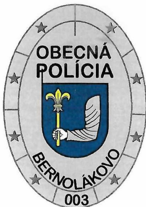
Príloha č. 4 : Vyobrazenie preukazu príslušníka obecnej polície