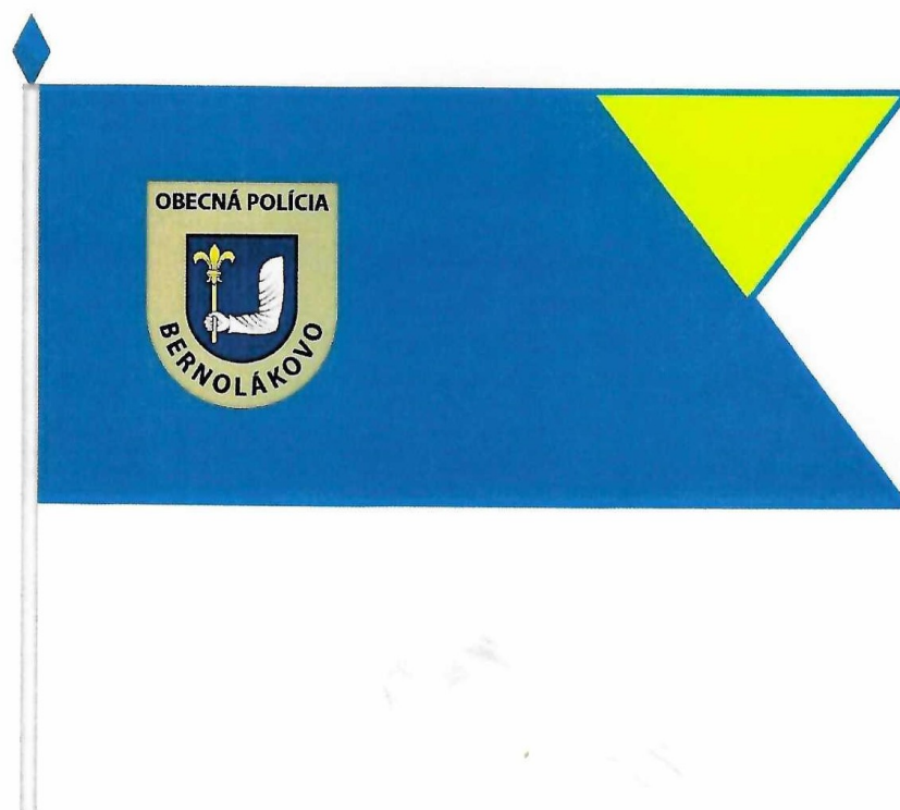
Príloha č. 2 : Znak Obecnej polície Bernolákovo