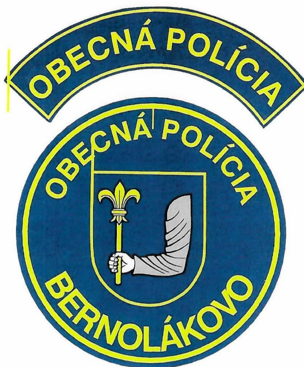
Príloha č. 3 : Identifikačný odznak príslušníka obecnej polície