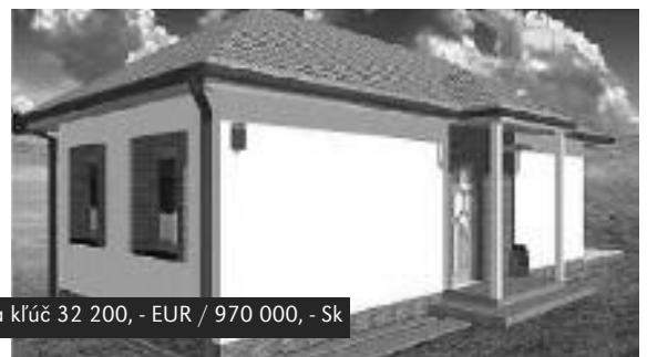
Cena na kľúč 32 200,- EUR / 970 000,- SK

Pre svoju bezkonkurenčnú cenu si ho môže dovoliť naozaj každý.