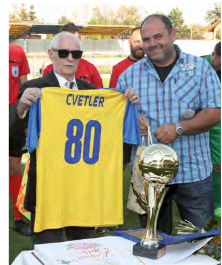
Fotografia zo slávnosti v Bernolákove