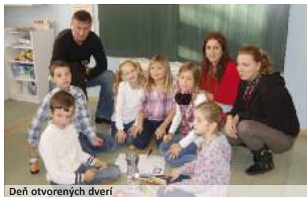
Deň otvorených dverí