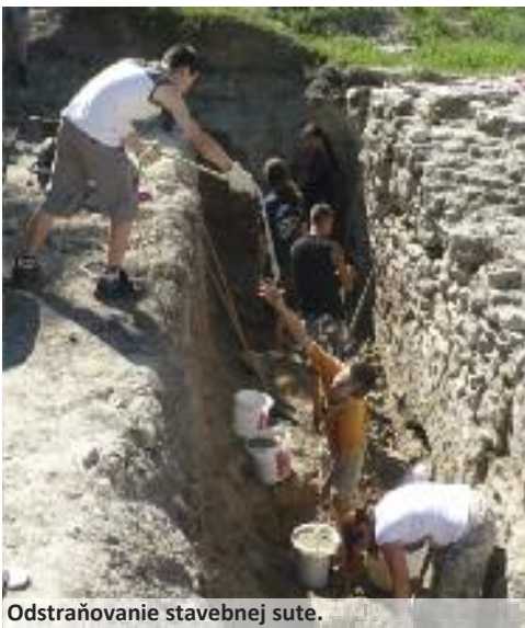
Odstraňovanie stavebnej suty.