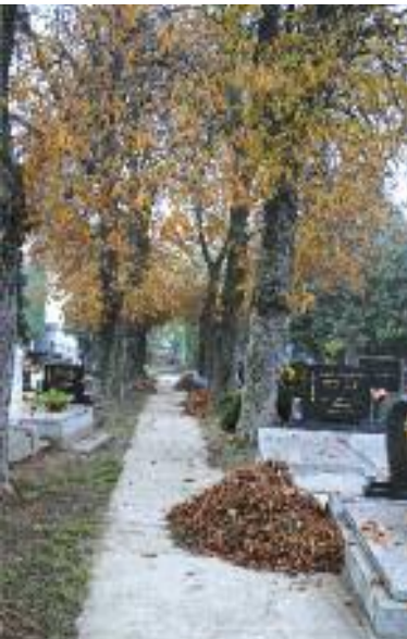
Výsledok usilovnej práce

Pred Sviatkom Všetkých svätých 24.10.2012 sa na miestnom cintoríne zišli na brigáde členovia združenia Nádej a Klubu dôchodcov v Bernolákove. Cieľom bolo upratať priestory cintorína a prispieť tak k dôstojnej atmosfére tohto sviatku. Za vykonanú prácu ďakujeme všetkým zúčastneným brigádnikom.