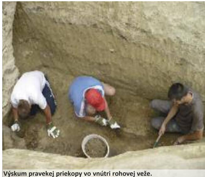
Výskum pravekej priekopy vo vnútri rohovej veže.