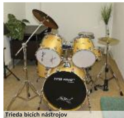
Trieda bicích nástrojov