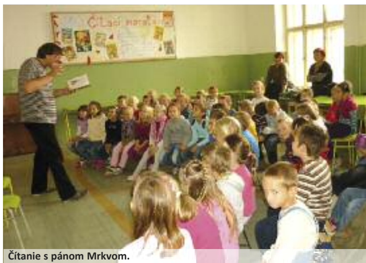
Čítanie s pánom Mrkvom.