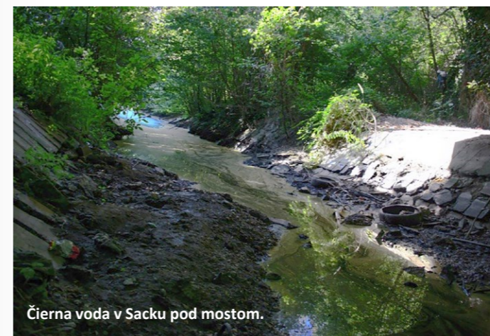
Čierna voda v Sacku pod mostom.