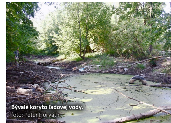
Bývalé koryto ľadovej vody.

Milé mamičky, oteckovia, starí rodičia, pozývame vás na už tradičnú