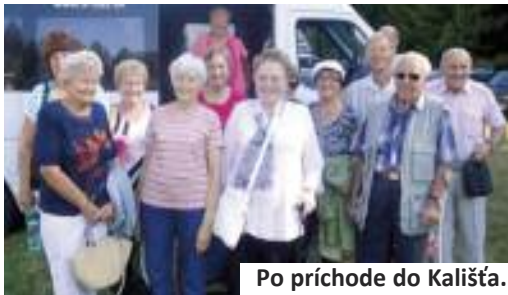
Po príchode do Kališťa.

Miestna organizácia Zväzu protifašistických bojovníkov v Bernolákove a občianske združenie Klub dôchodcov Bernolákovo usporiadali 17. augusta 2013 zájazd na 8. ročník Stretnutia generácií v Kališti, ktorého sa zúčastnilo 19 členov.