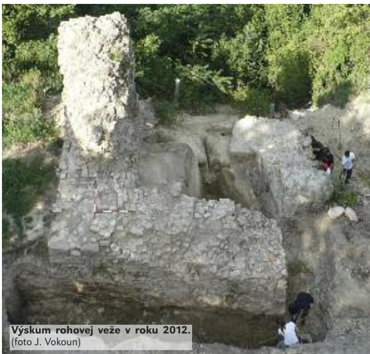
Výskum rohovej veže v roku 2012.