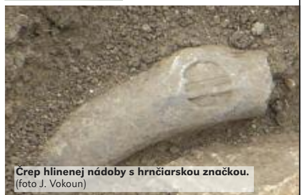
Črep hlinenej nádoby s hrnčiarskou značkou.