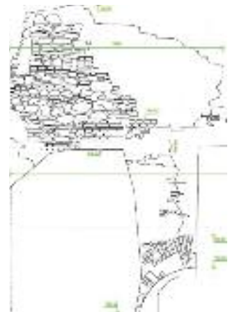
Nákres odľahčovacieho oblúka v sonde hlbokej 3 m. (autor Ing. P. Babál)