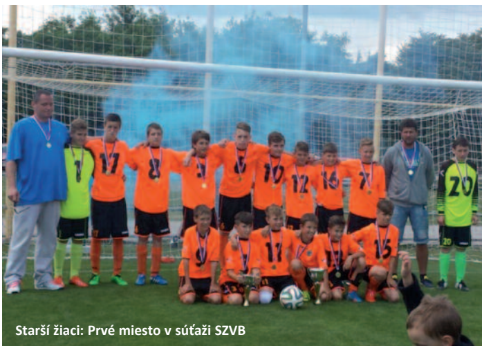
Starší žiaci: Prvé miesto v súťaži SZVB