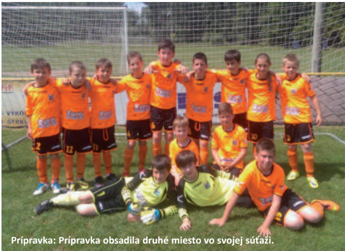
Prípravka: Prípravka obsadila druhé miesto vo svojej súťaži.