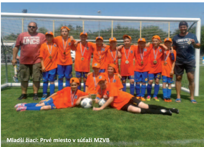
Mladší žiaci: Prvé miesto v súťaži MZVB