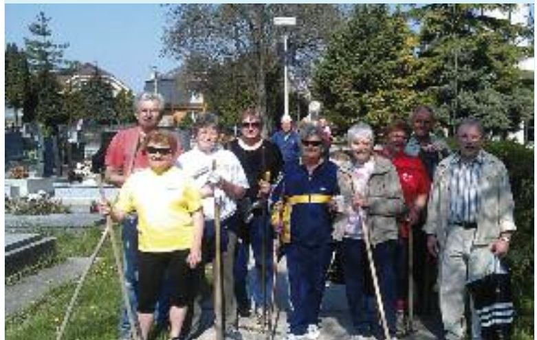
Brigádnici na cintoríne

Vážime si snahu a aktivity všetkých brigádnikov o skrášlenie obce a ĎAKUJEME. ŽP