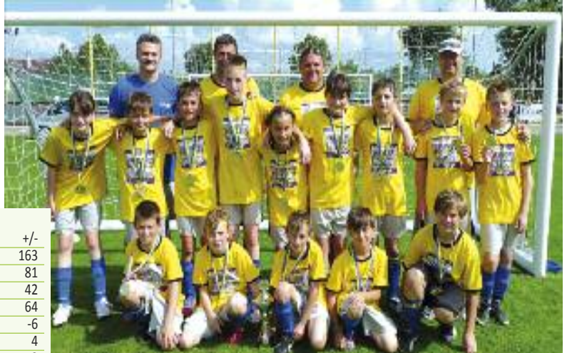
Tabuľka 2012/2013 Pr - SC

Ukázalo sa, že investícia obce do vybudovania športového areálu a jeho údržby neboli zbytočné. Bernolákovu rastú ďalšie nádeje, ktoré perspektívne