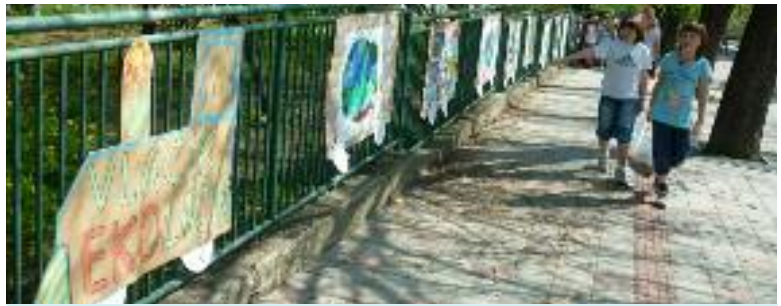
Eko výstava na starej škole