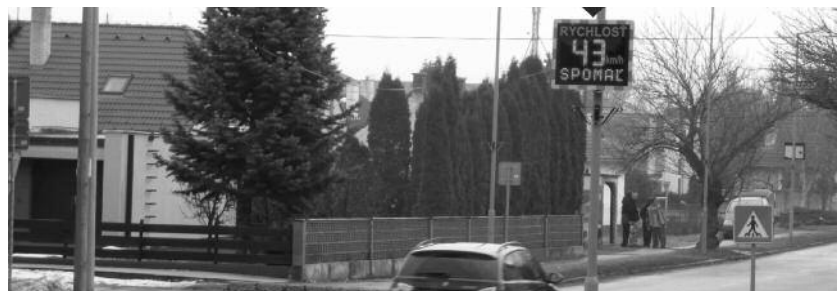
Pohľad od supermarketu LIDL