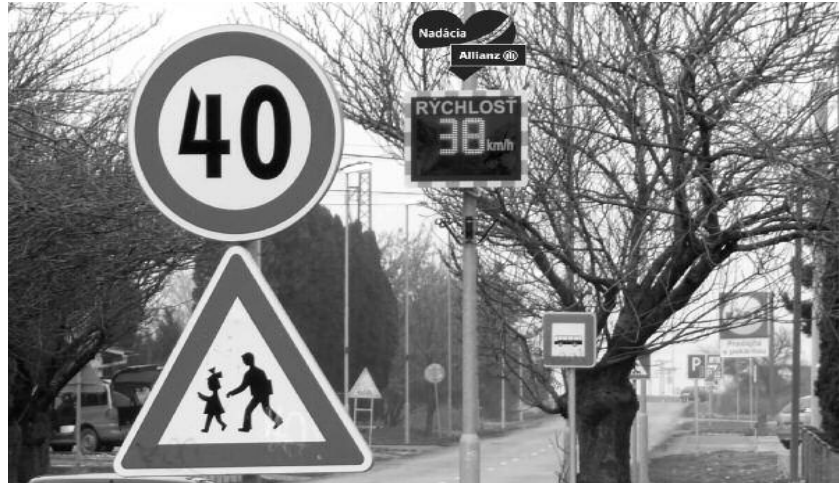
Pohľad od Hlavnej ulice