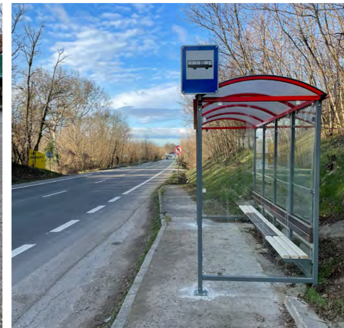
Nová zastávka Sacky.