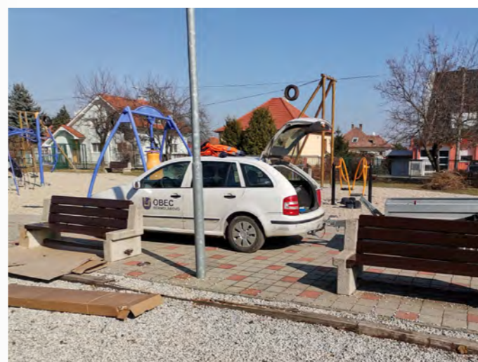
Zamestnanci prevádzky postupne renovujú a opravujú lavičky na ihrisku a upravujú aj jeho okolie.