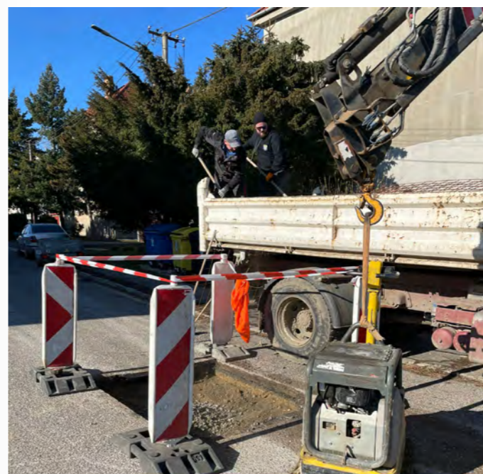
Oprava komunikácie na Družstevnej ulici.