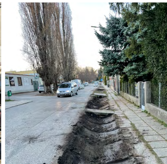
Na viacerých miestach sa upravili a prehĺbili jarky.