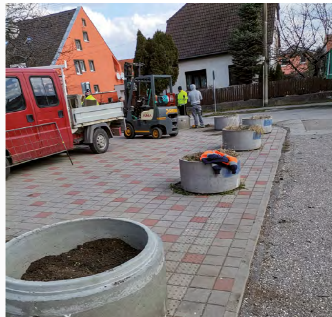
Pri ihrisku sa vymenili poškodené skruže za nové.